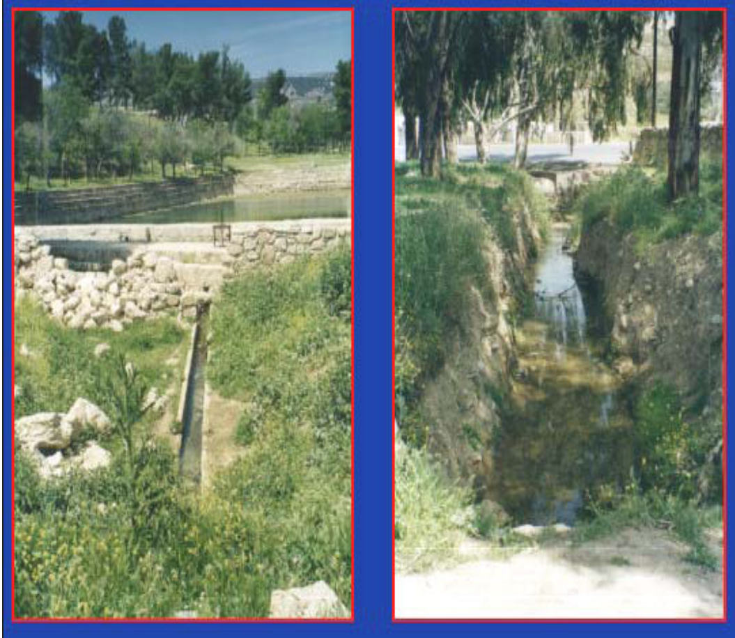
Plate (Photo) 1. A Photo of Qantara Spring Watershed